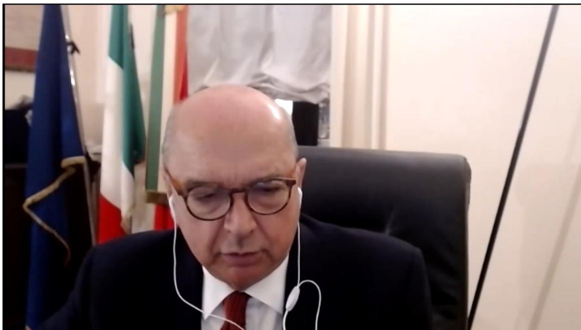
Il sindaco Roberto Dipiazza nomina ufficialmente consigliere e consiglieri delle 10 scuole aderenti al progetto

consigliere e consiglieri tante soddisfazioni nel lavorare per far sì che la città diventi sempre più bella.