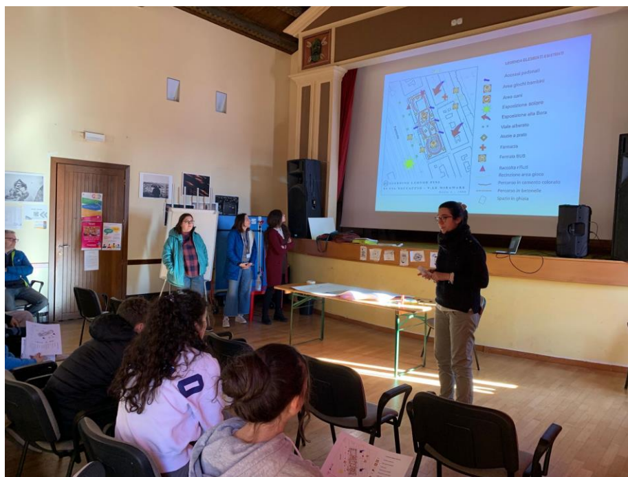
Discussione sulla mappa riassuntiva