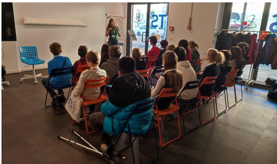
Presentazione dei temi

Dopo la presentazione dei temi, i partecipanti sono stati suddivisi in tre gruppi per approfondire la riflessione. A ciascun gruppo è stato chiesto di ragionare insieme su ciascuna delle sei tematiche in discussione, esplorando l'importanza di ciascun tema, la loro urgenza e le aree in cui i partecipanti sentivano di poter avere un impatto maggiore, sia come membri del consiglio comunale che come singoli cittadini.