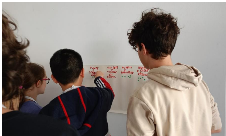
Il momento della votazione

Si è poi proseguito alla votazione dei progetti. Il metodo utilizzato si è basato su un sistema a punti, rappresentati da adesivi verdi. Ogni consigliere ne ha ricevuti tre, potendo decidere come distribuirli: indicando tre preferenze diverse o concentrandoli su una sola o due proposte per manifestare un maggiore interesse.